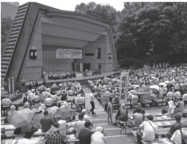
全国から48県連・組合1936人が参加

「全建総連7・7賃金・単価引き上げ、予算要求中央総決起大会」が7月7日、東京・日比谷大音楽堂・小音楽堂を会場に開催され