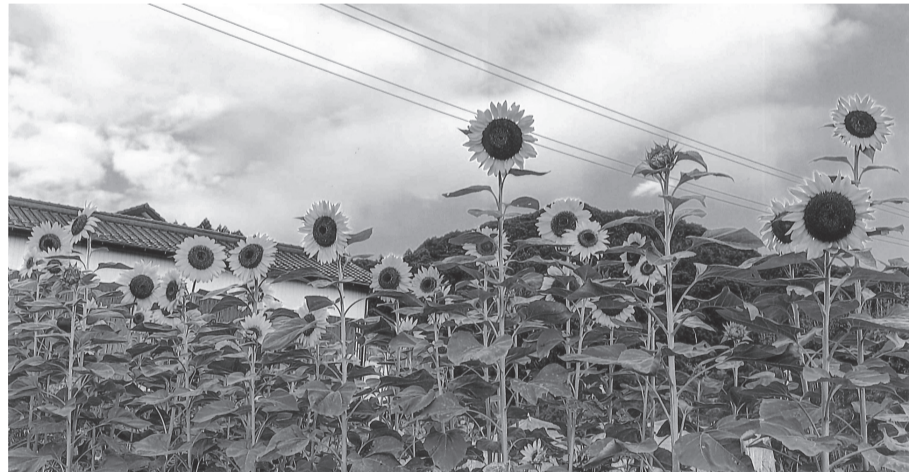
2mのひまわりが約50本開花