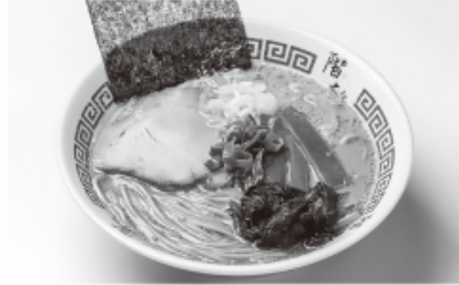
こだわりの詰まった一杯