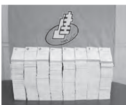
今年夏に集まったハガキ

現在、秋のハガキ要請行動をお願いしているところ。今回は厚生労働省4人、財務省4人の計8人へのハガキ要請行動となります。夏の要請行動に引き続き、この秋の要請行動への御協力をお願いいたします。