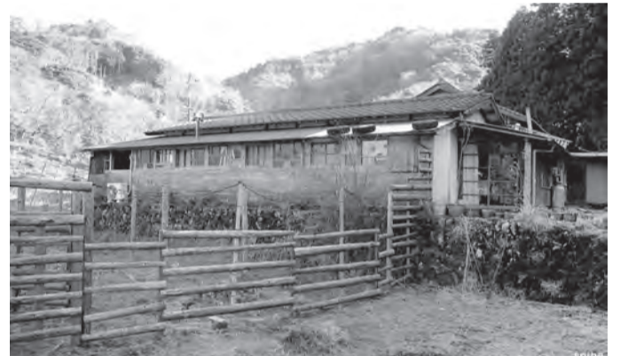
古い牛舎を改築した店舗は温みがあり懐かしさも漂う