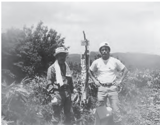
親父と山頂での思い出

史郎山がある。島根県境の長瀬峡(金山谷)の東側に位置する堂々とした山は、中国道からも分かる。登山口は2箇所あり、山口県側向峠か島根県の金山からのルートが開かれている。どちらの道も辛い歩きですが、ゆっくり登ることが肝心ですね。