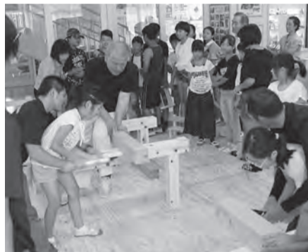
指導員と一緒に角材切り体験