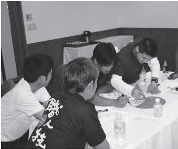
各々が知恵を出し合いポスター作製

中国地協青年部交流集会在山口の引き受けで、7月14〜15日の2日間、山口市の「ホテルかめ福」を会場に、4県連・組合54人の参加で開催されました。