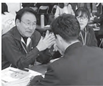
計13人の高校生にアドバイス

「2019県内進学・仕事魅力発信フェアin やまぐち」が2月14日、維新百年記念公園スポーツ文化センターで開催されました。県内の高校1年生・