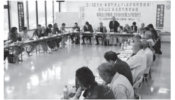
各支部より代表34人が参加

平成31年3月から の山口県公共工事設 計労務単価は、左表 のとおり7年連続で 引き上げとなってい ます。この現状を踏 まえて、「賃金・単価 引き上げ、法定福利 費確保」建設山口各 支部代表者学習会」 を3月12日に支部代