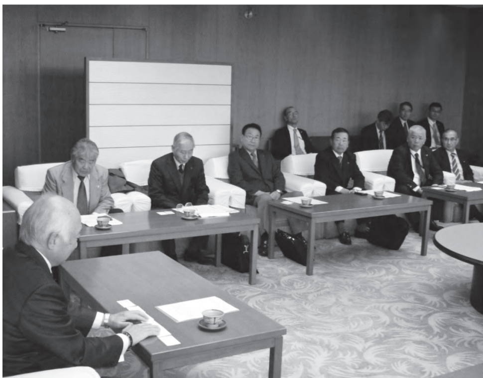
山口県議会議長を訪問 (H30.12/11 山口県庁)

担い手不足が深刻化 一人親方は健康診断する建設業。就労環境(労働安全衛生法)上の整備は大きな課題となっており、特に、保護対象とならな