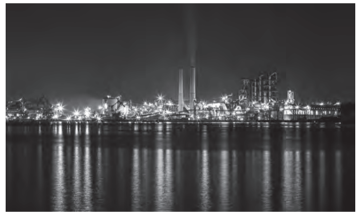
周南コンビナートの夜景