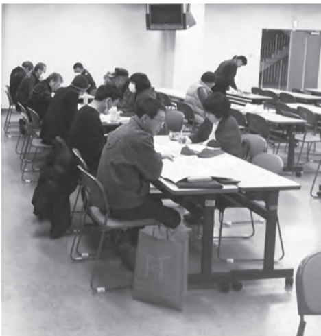
下関会場では多くの相談者が来場

組合では、所得税の 確定申告相談会を独自 に実施していない各支 部に対して、本部から 相談員が出向き、決算 書や申告書作成のお手 伝いをする取組を継続 して行っています。 2月5日の岩国会場 を皮切りに、独自開催 支部を含め、17会場で 実施。合計2100人の 相談者がありました。 内訳は、白色申告10 3人、青色申告85人、 給与22人でした。 「減価償却の計算を チェックして欲しい」 「消費税の計算を願 いしたい」「一通り作っ てみたが、確認の意味 でチェックして欲し い」など、相談内容も 様々です。