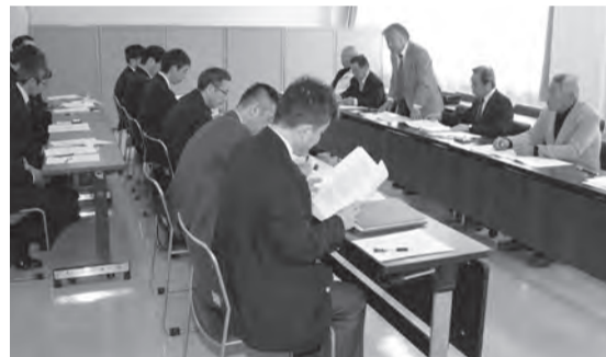
吉村委員長が現場の実情を訴える