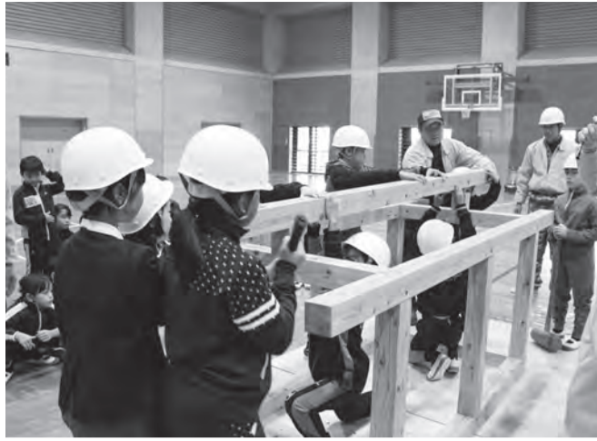
力を合わせて木組体験 (下松小学校)

1月24日、組合の中にある(一社)山口県住宅建設協会として、下松市立下松小学校で