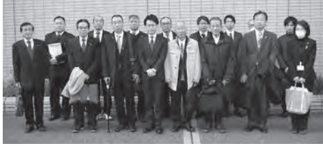
中国五県から17人が参加