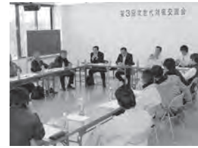
貴重な意見交換の場

建設山口青年部は、1月20日、次世代対策交流会を建設山口本部会館にて基本組合10人、青年部10人、計20人の参加者で開催しました。3年前にスタートしたこの交流会は後継