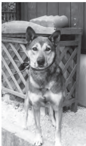
メルちゃん。7歳の女の子