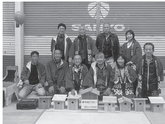
主婦の会も含め総勢10名の参加で開催