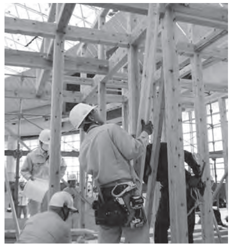
大工20人・管理者10人で施工実習