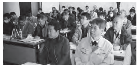
午前中は施工説明の座学