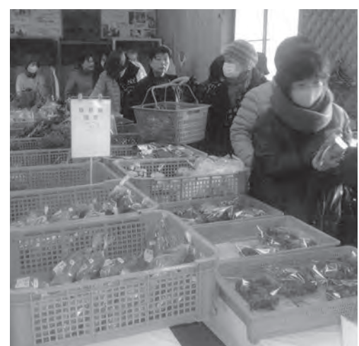
多くの人でにぎわう直売所