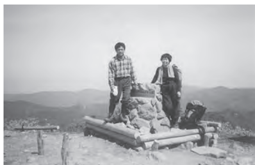
氷ノ山山頂 (1,510m) にて