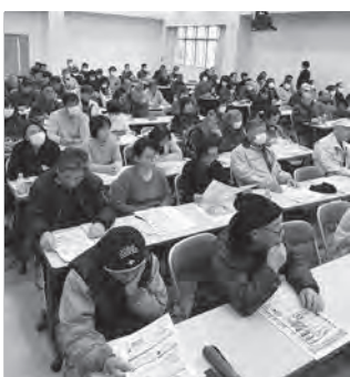
熱心に説明を聞く参加者