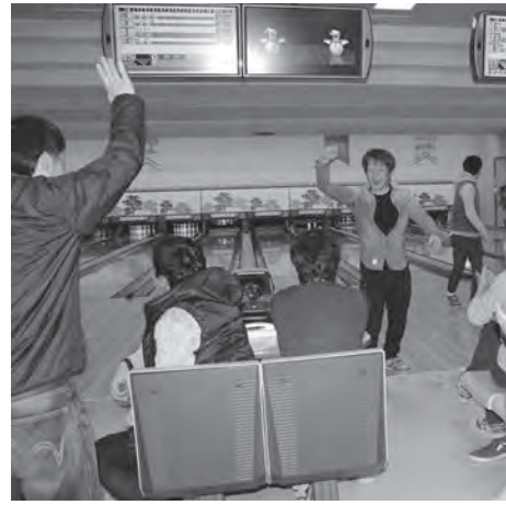
11支部30人の参加者で交流