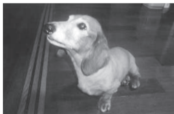
名前の由来はフランス皇帝

我が家の愛犬「ダックスフロント」の話をしましょう。 1994年(平成6年)4月10日生まれ・血統書に書いてある)23歳オス、名前はルイ君。この名前はフランス皇帝から付けたとのこと。ルイ君を引き取ったわけは、所有者があらう方に譲ったのですが、