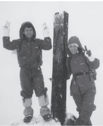
中岳山頂 (1,790.8m) にて

樽を開け宿泊客に振舞っていた。山から帰れば酒が待っている楽しみがあるので、ついつい正月は九重に入るようになった。 9割の泊まり客は初日の出を期待して暗い内から山に出掛けているが、私たちは明るくなつて登山準備。冬山の装備を整えアイゼンを履き出発する。白口谷から最高峰中岳に登り御池の凍結を写真に撮り、久住山に向かう。あいにくの天気で阿蘇山は降りしきる雪で見えない。気温も零下で足早に北千里に下山、すがもり越えからコマドウ岩を抜け法華院温泉に戻る。冷えた身体はお酒で温める。天国気分が酔い、うたたねの心地良さに九重の山々に畏敬と感謝の思いが、より深くなった実感が湧く。近い内にミヤマキリシマが満開の頃、坊がツルで野営を楽しもうと胸を膨らます。冬の九重連山は静かに雪が降り続けている。