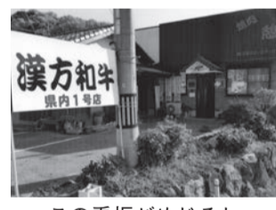
この看板がめじるし

住所：柳井市阿月 780-5 電話：0820-27-0758 営業時間：17:00～23:30 定休日：12月30日～1月4日