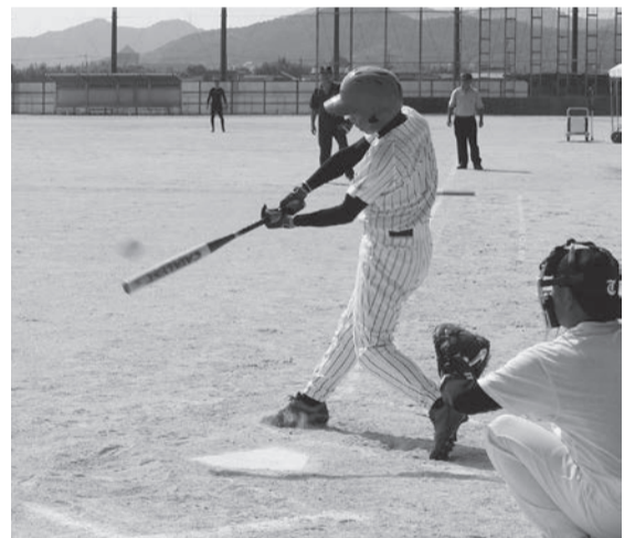
決勝戦では下松打線が爆発