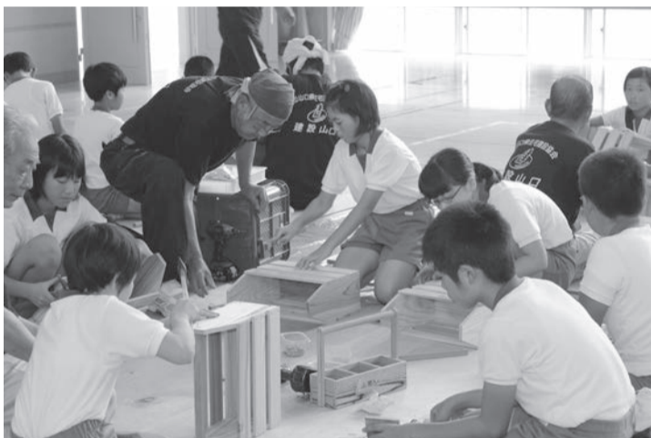
②参加者全員で木工教室も(萩)