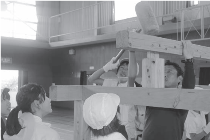
①かけやを使って棟上げ(下松)