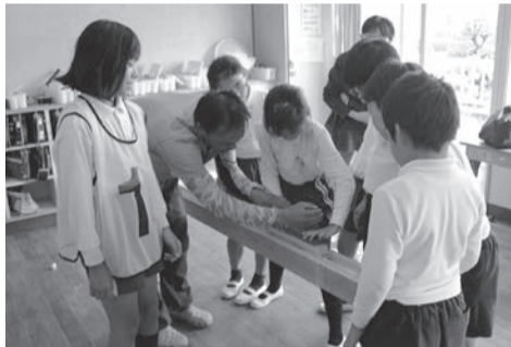
④大工さんとカンナ削り体験(防府)