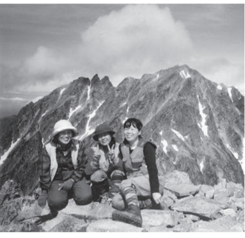
前穂高山頂から奥穂高方面を背景に

上高地「河童橋」から仰ぎ見る穂高連山の眺めは素晴らしい！ 梓川の清流を廻り、横尾谷を登る。屏風岩を左手に見ながら涸沢に入ると景色が一変する。まずカール(氷河に削られた谷)奥にそびえる涸沢槍の凜とした姿が眼に飛び込む。