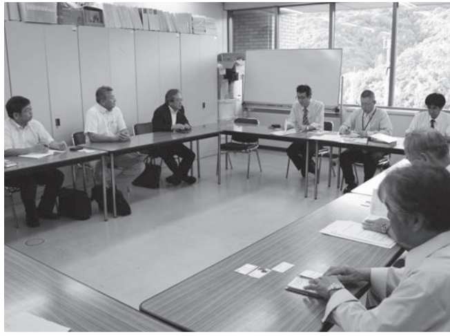
県庁15階で関係団体を交えての協議